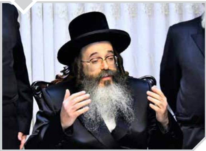
ואלה המשפטים (כא א)

כ"ק מרן אדמו"ר מ'תולדות משה' שליט"א, עם דברים נפלאים ומחזקים בעבודת ה', לרגל סיום ימי השובבי"ם